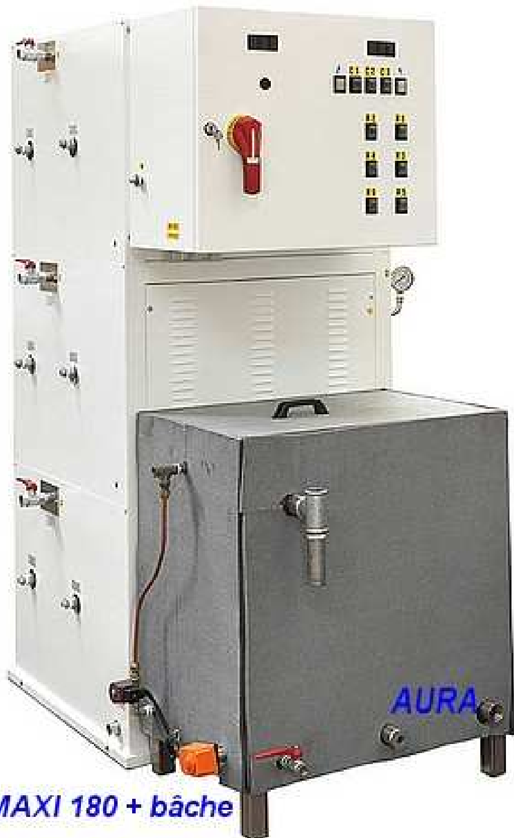
MAXI 180 + bâche